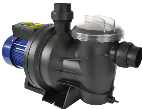
SCHWIMMBADPUMPE POOL-STAR 1200 (5 009 001 005)