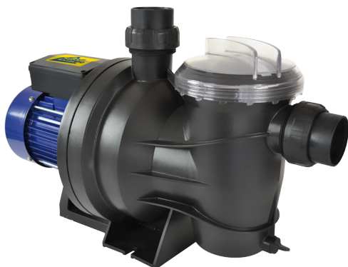
SCHWIMMBADPUMPE POOL-STAR 800 (5 009 001 002)