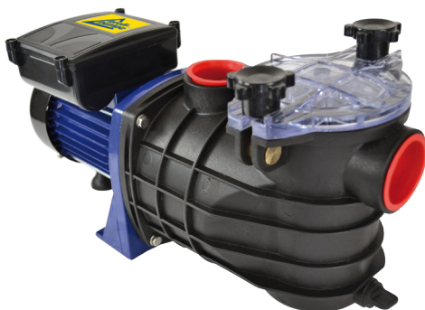
SCHWIMMBADPUMPE POOL-STAR 500 (5 009 001 001)